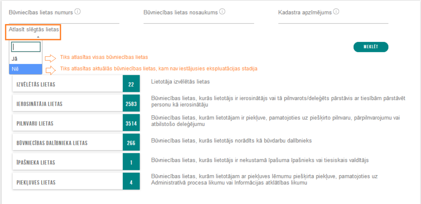
2. attēls Būvniecības lietu atlase publiskajā BIS portālā

! Jāņem vērā, ka katru reizi pēc autorizēšanās BIS kritēriji ir jāatjauno, jo tiek netiek saglabāti.